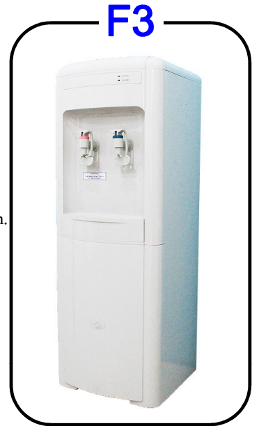
ระบบการกรอง 3 ขั้นตอน

รับประกันความเย็น 1 ปี , ภายใต้งานใช้งานปกติ(ตัวตู้อุปกรณ์ภายนอกและไส้กรองน้ำไม่รับประกัน)